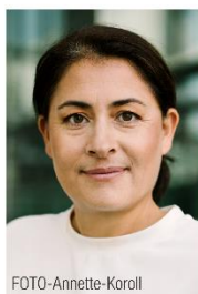
Filiz Polat B90/Die Grünen