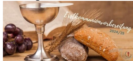
PFARREIENGEMEINSCHAFT BAD ESSEN · OSTERCAPPELN · SCHWAGSTORF

Nicht mehr lange und ein neuer Erstkommunionjahrgang startet! Der erste Elternabend für die Bad Essener Kommunionkinder findet am Dienstag, den 01.10.2024 um 20:00 Uhr im neuen Pfarrheim statt.